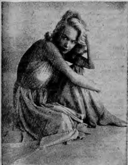
Sandra Dee la versátil actriz norteamericana que acaba de divorciarse del cantante Bobby Darin, será vista en otra de sus simpáticas películas "Tres para la boda", será próximamente estrenada en nuestro medio, y creemos que será bien recibida porque Sandra cuenta en Costa Rica con muchos admiradores.