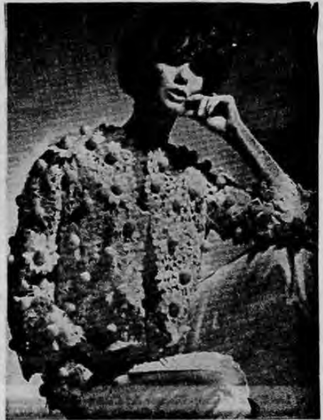
Para las que gustan usar pantalones pero que también desean verse muy femeninas nada como este bello conjunto de pantalón de seda gruesa y chaqueta de encaje todo en blanco, y que realza maravillosamente la belleza de la modelo.