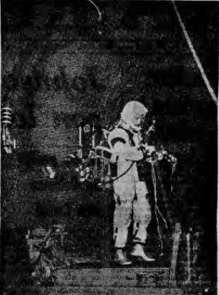
CAMINANDO POR LA LUNA.— Un individuo vestido con traje espacial camina bajo condiciones simuladas de gravedad lunar, en el centro de vuelos tripulados de Houston, Texas. Esta prueba tiene por objeto ayudar a los científicos norteamericanos a conocer los efectos que la actividad física tendrá sobre las funciones del cuerpo humano, cuando los astronautas transiten por la superficie lunar. La fuerza de gravedad de la Luna es una sexta parte de la gravedad en la Tierra.

Un avión canadiense sorbó brevemente alimentándose con pescado que llevaba de carga y logró conservar la suficiente fortaleza para bajarse del avión.