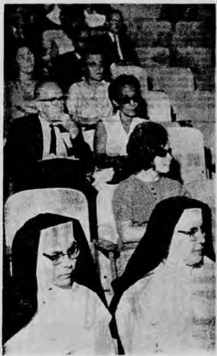
Laicos y religiosos se confundieron ayer para discutir la necesidad de una política de acción social mejor coordinada entre las instituciones. Representantes de organismos públicos y privados están asistiendo al Seminario, cuyos frutos en el primer día de trabajo fueron calificados de excelentes.