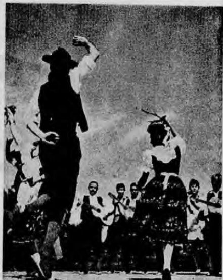
Han continuado, en medio del mayor entusiasmo los preparativos para la tradicional romería a Ujarráz organizada por la Colonia Española.

(En nuestra edición de mañan publicaremos las gráficas de este evento)