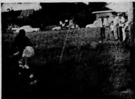
Este fue el segundo gol de los Peters F. C. El portero del Club Alemán Luder lo trató de interceptar el balón pero su mala ubicación se lo impidió.